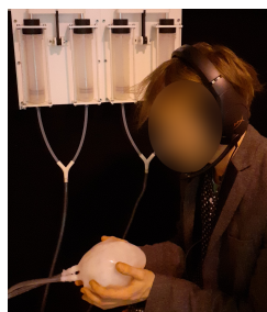
FIGURE 2 – Iagotchi, incarné par son cœur battant, discutant avec un visiteur

Lors du salon Expérimenta à Grenoble, Iagotchi a été mis à disposition du public (Figure 2). Le